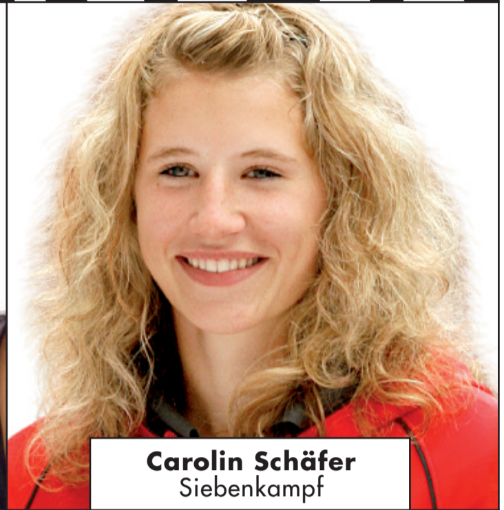
Carolin Schäfer Siebenkampf