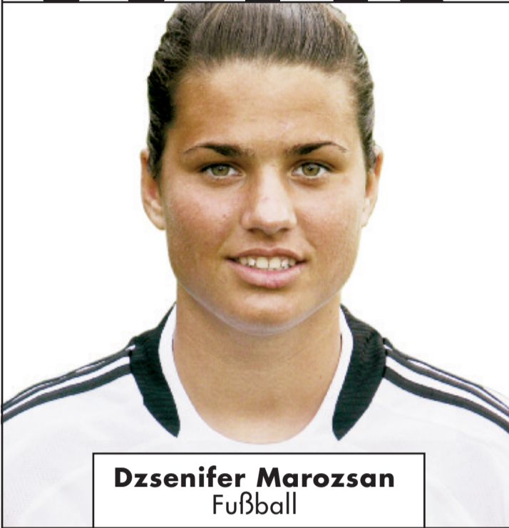
Dzsener Marozsan Fußball