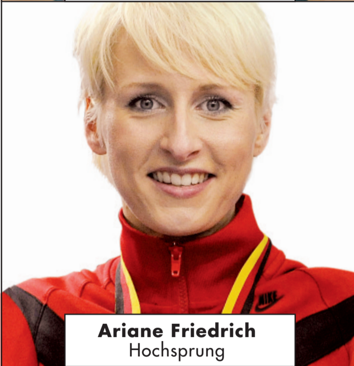
Ariane Friedrich Hochsprung